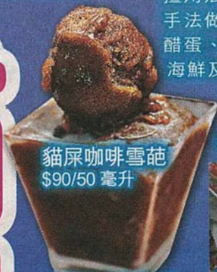
貓屎咖啡雪葩 $90/50 毫升

雪糕の森老闆 Arron 擅用法式 Fine Dining 手法做雪糕，今年有薑醋蛋、溏心鮑魚、香辣海鮮及貓屎咖啡等新口味，全以純天然原料，質感軟滑香濃。